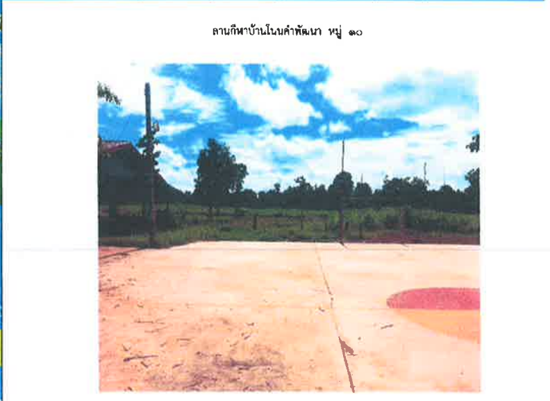
ลานกีฬาบ้านโนนคำพัฒนา หมู่ ๑๐