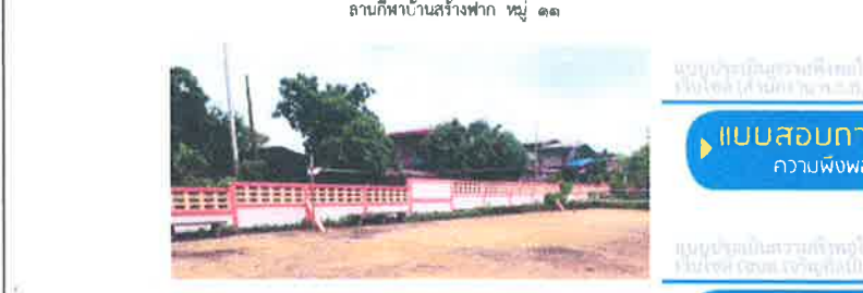
ลานกีฬาบ้านสร้างฟ้า หมู่ ๑๑