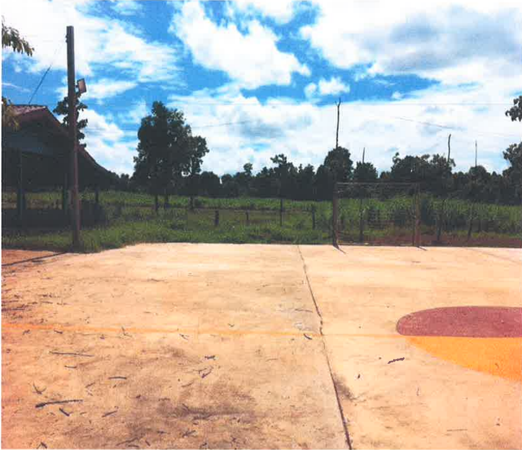
ลานกีฬาบ้านสร้างพาก หมู่ ๑๑